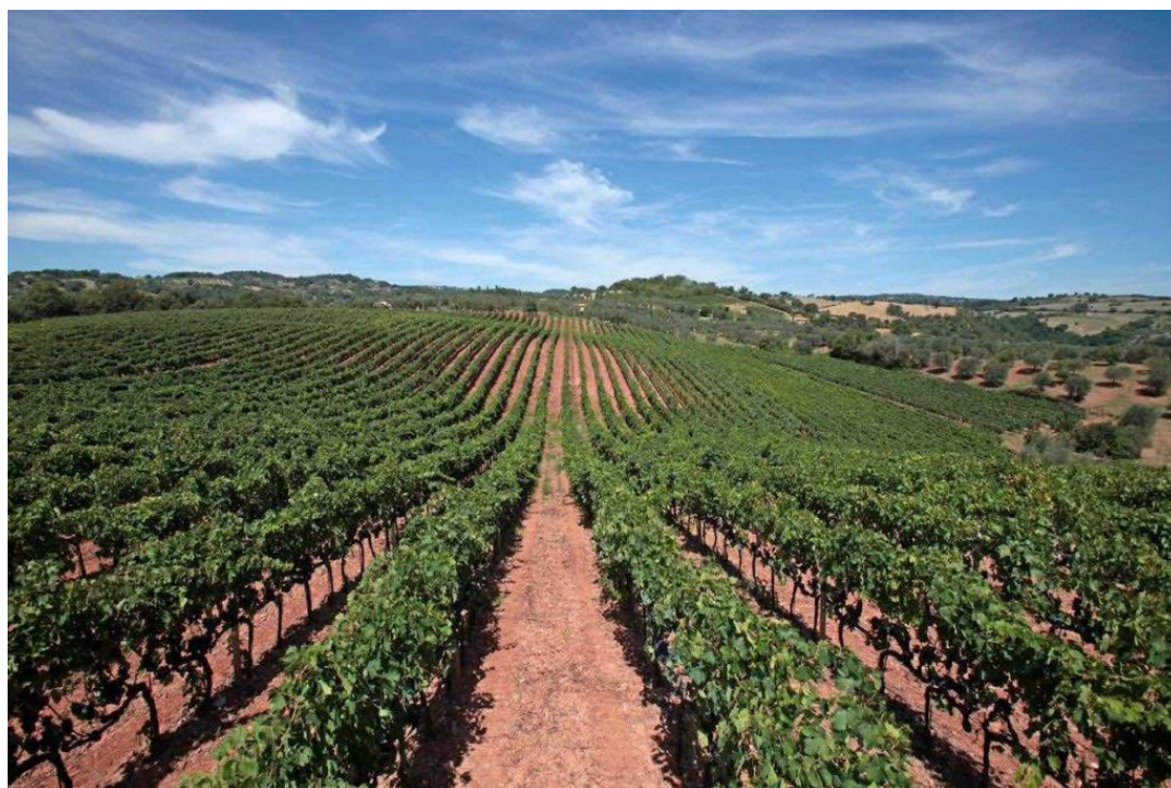
Riconosciuto denominazione di origine controllata nel 1978, il Morellino di Scansano ha da poco festeggiato i suoi primi 40 anni

Riconosciuto denominazione di origine controllata nel 1978, il Morellino di Scansano ha da poco festeggiato i suoi primi 40 anni. In questo periodo molto è stato fatto per la sua valorizzazione. A iniziare con l'ottenimento, nel 2006, della Docg di cui si è potuto fregiare a partire dalla vendemmia 2007. Attivo nell'opera di promozione e tutela dell' eccellenza maremmana è il Consorzio Tutela Morellino di Scansano, nato nel 1992 per volontà di un piccolo gruppo di produttori. Nel corso degli anni, l'ente consortile è andato man mano ampliando il proprio serbatoio associativo, fino ad arrivare oggi ad accogliere più di 200 soci , oltre 90 dei quali con almeno una propria etichetta di Morellino di Scansano sul mercato.