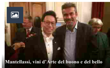
Mantellassi, vini d'Arte del buono e del bello