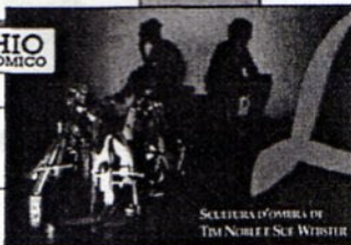
SELEZIONE D'OPERA DI TIM NOBLE E SCOTT WEBSTER