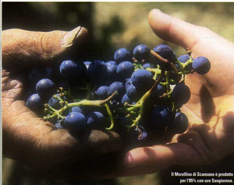
Il Morellino di Scansano è prodotto per l'85% con uve Sangiovese.

Un punto di partenza e non di arrivo: così i produttori di Morellino di Scansano intendono la Docg, recentemente riconosciuta. Una denominazione in costante ascesa in termini di qualità e notorietà